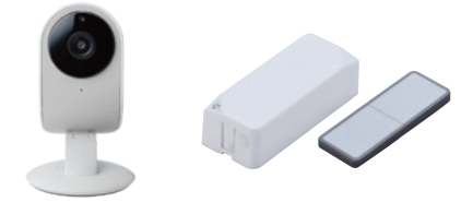
ネットワークカメラ 03