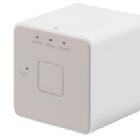
無線通信アダプタ (A)